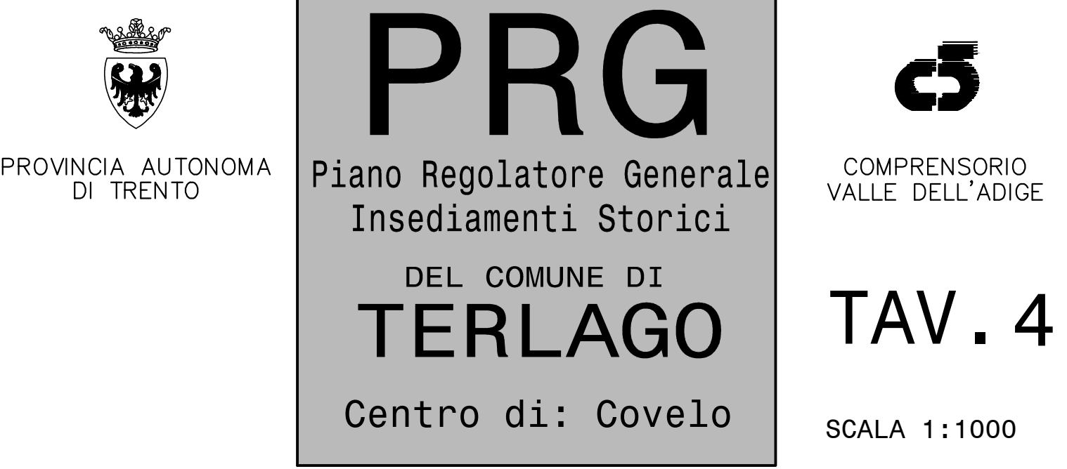
TAVOLA DEGLI INTERVENTI PRIVATI ADEGUAMENTO AL PUP E AGLI INDIRIZZI E CRITERI PER LA PIANIFICAZIONE DEGLI INSEDIAMENTI STORICI DEGLI INSEDIAMENTI STORICI STABILITI DALLA GIUNTA PROVINCIALE CON D.G.P. N. 20156 DD. 30.12.92, AI SENSI DELL'ART. 24 E 139 DELLA L.P. 22/91