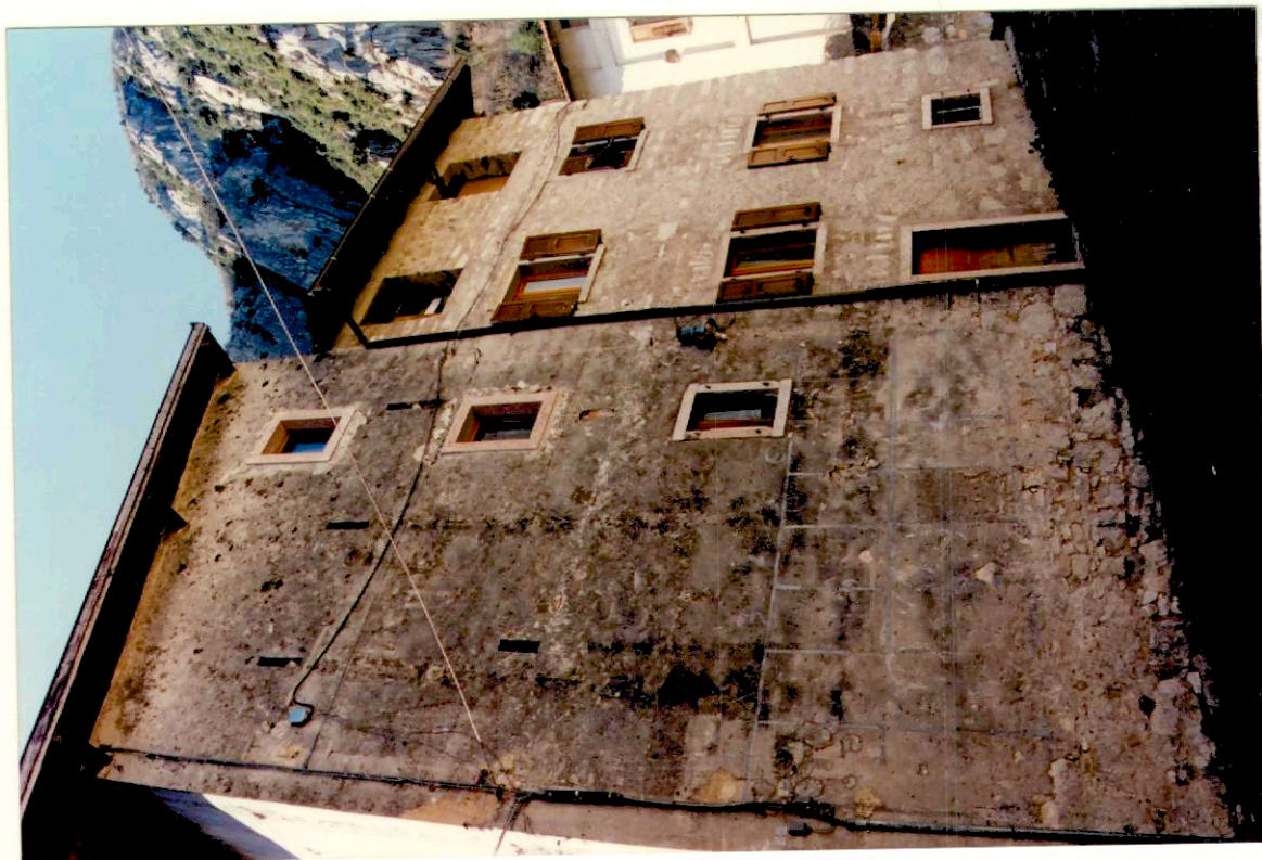
Documentazione fotografica - Immagine 2 (Rif.archivio:negativo ___ fotogramma ___)