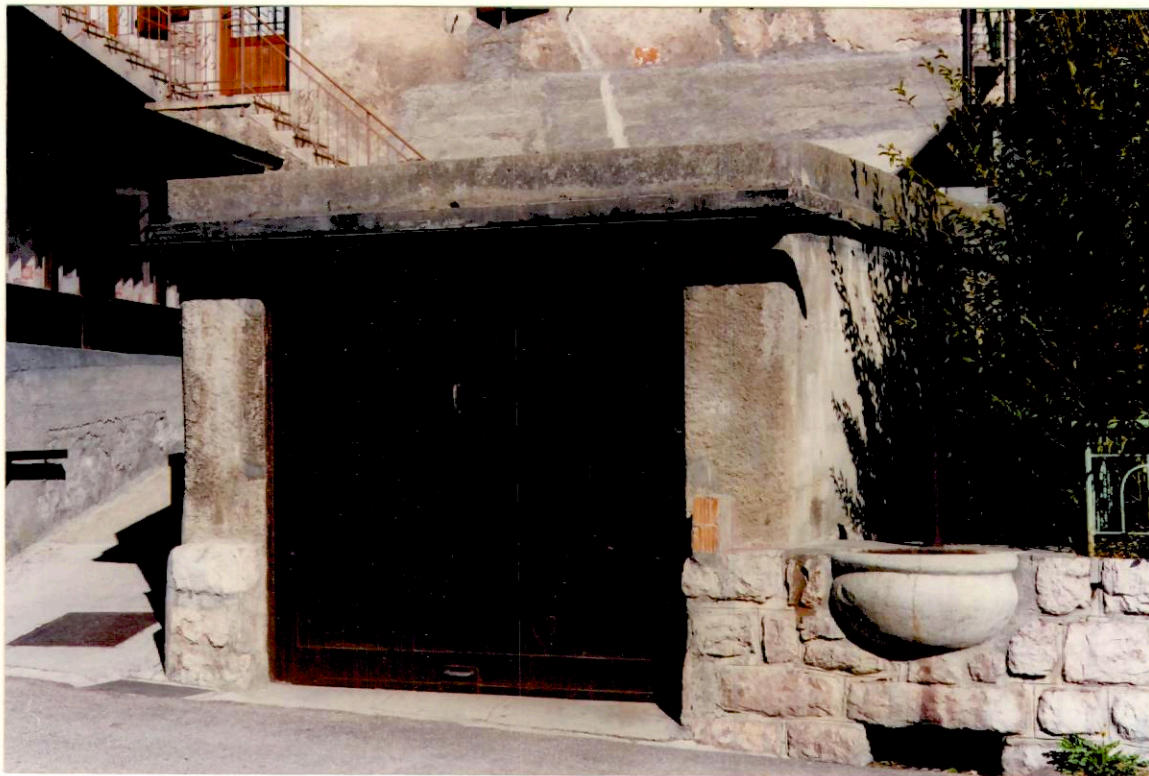
Documentazione fotografica - Immagine 2 (Rif.archivio:negativo___fotogramma___)