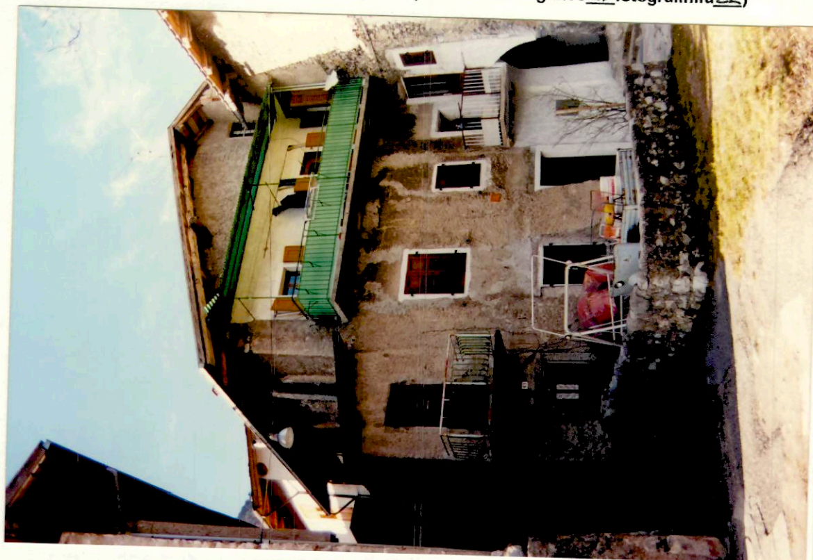
Documentazione fotografica - Immagine 4 (Rif.archivio:negativo__ fotogramma__)