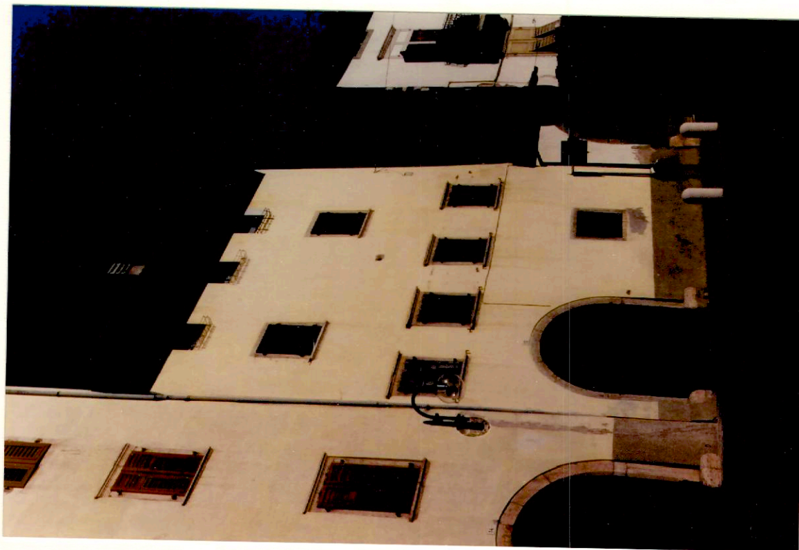
Documentazione fotografica - Immagine 2 (Rif.archivio:negativo ___ fotogramma ___)