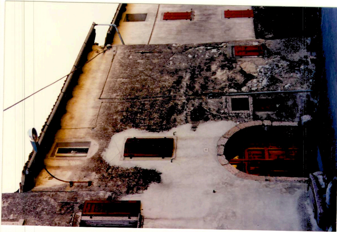
Documentazione fotografica - Immagine 2 (Rif.archivio:negativo___fotogramma___)