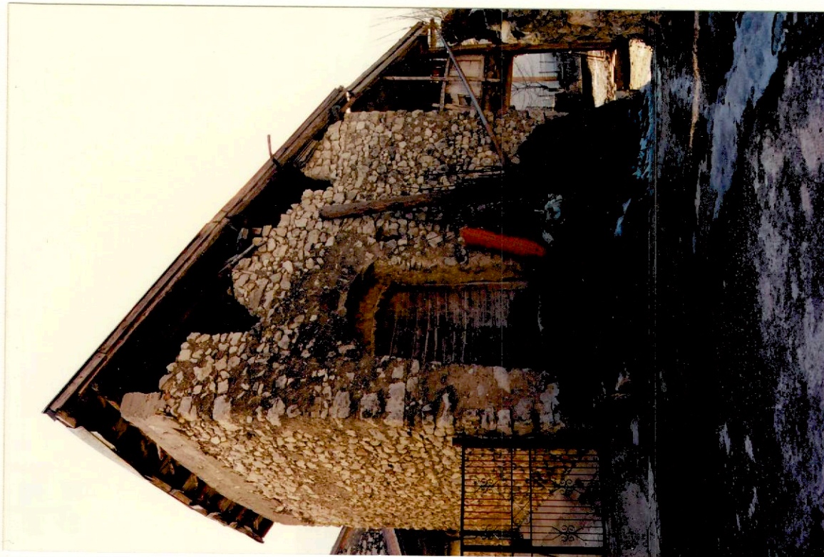
Documentazione fotografica - Immagine 2 (Rif.archivio:negativo__fotogramma__)