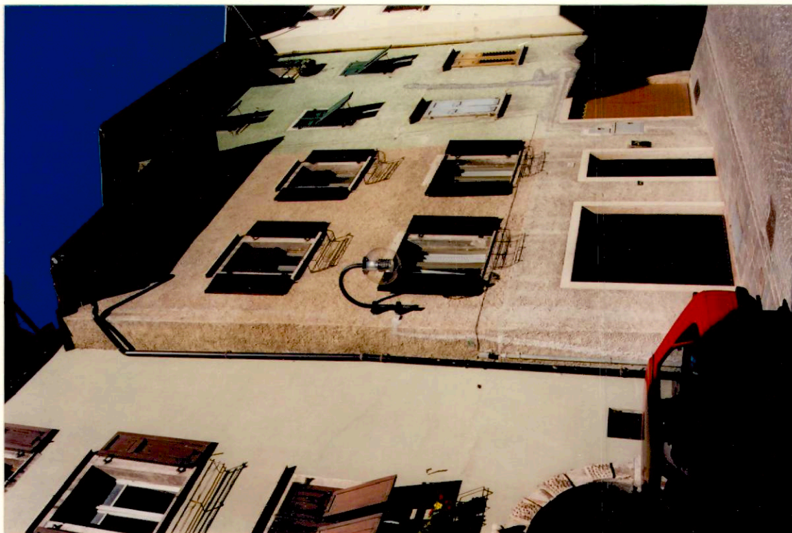
Documentazione fotografica - Immagine 2 (Rif.archivio:negativo__ fotogramma__)