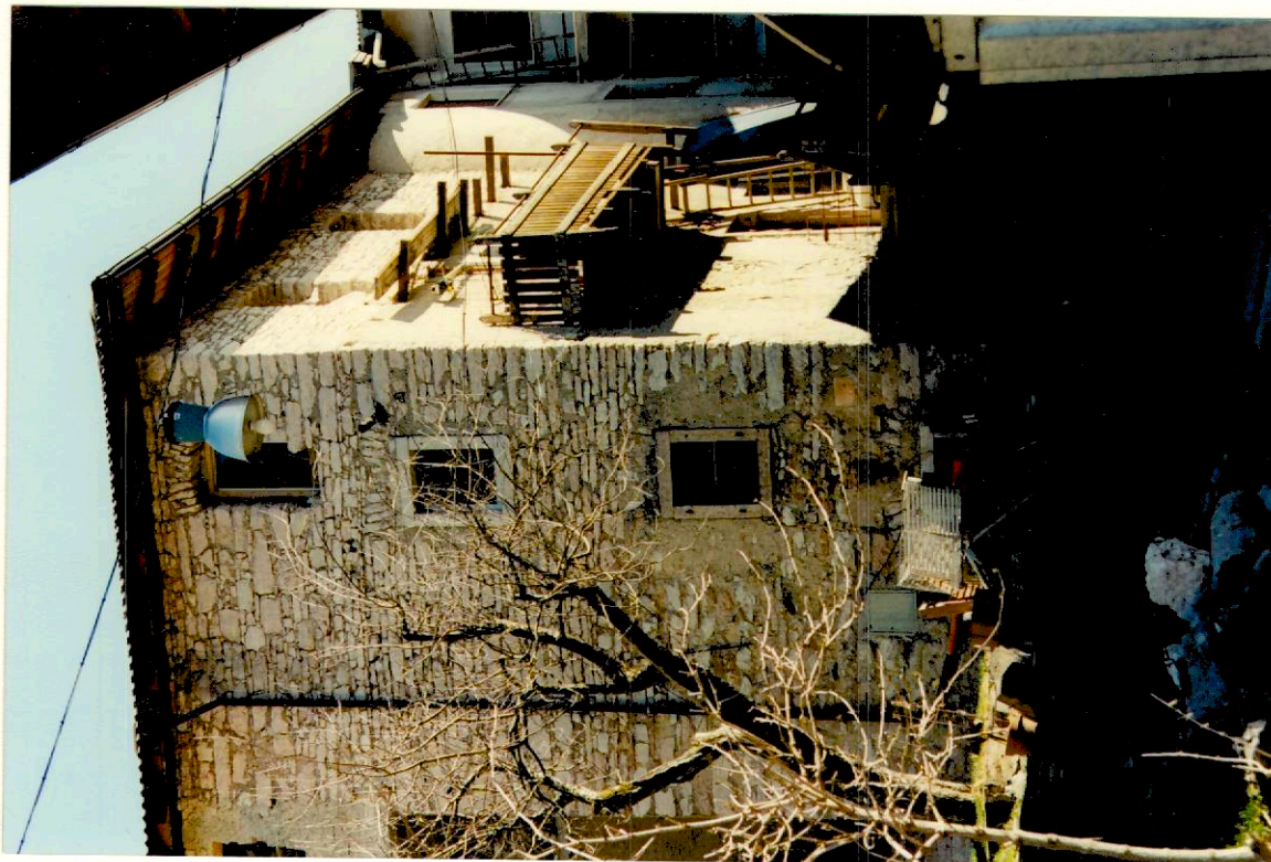
Documentazione fotografica - Immagine 2 (Rif.archivio:negativo___fotogramma___)