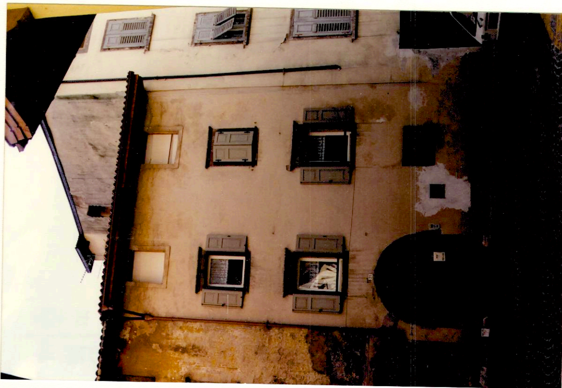
Documentazione fotografica - Immagine 2 (Rif.archivio:negativo___fotogramma___)