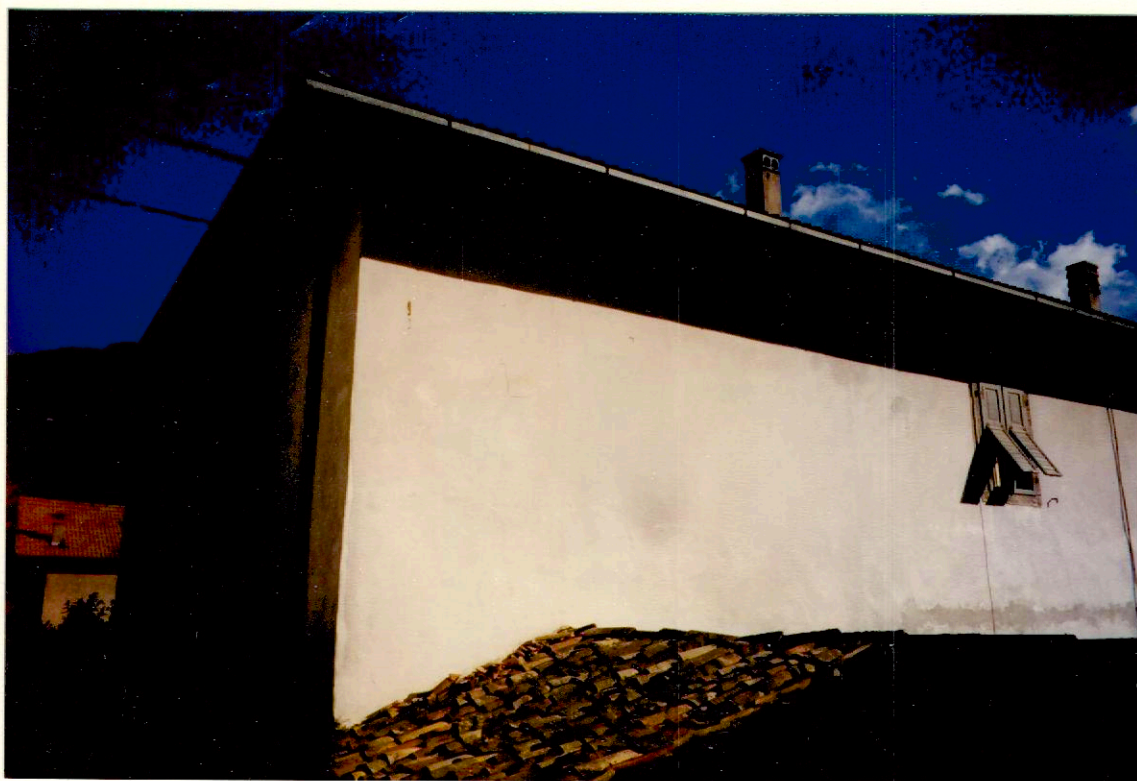
Documentazione fotografica - Immagine 2 (Rif.archivio:negativo__fotogramma__)