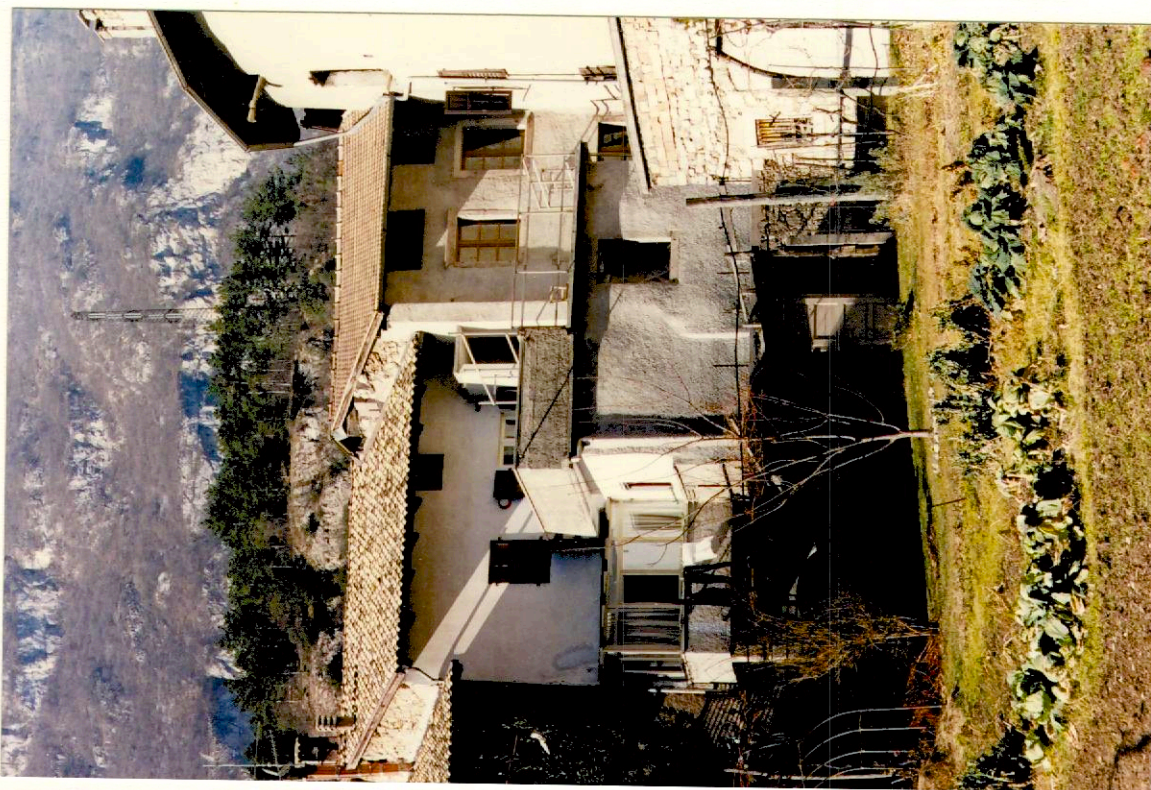
Documentazione fotografica - Immagine 2 (Rif.archivio:negativo___fotogramma___)