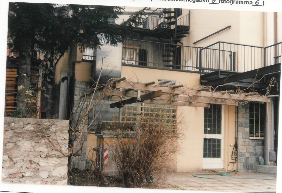
Documentazione fotografica - Immagine 2 (Rif.archivio:negativo__ fotogramma__)