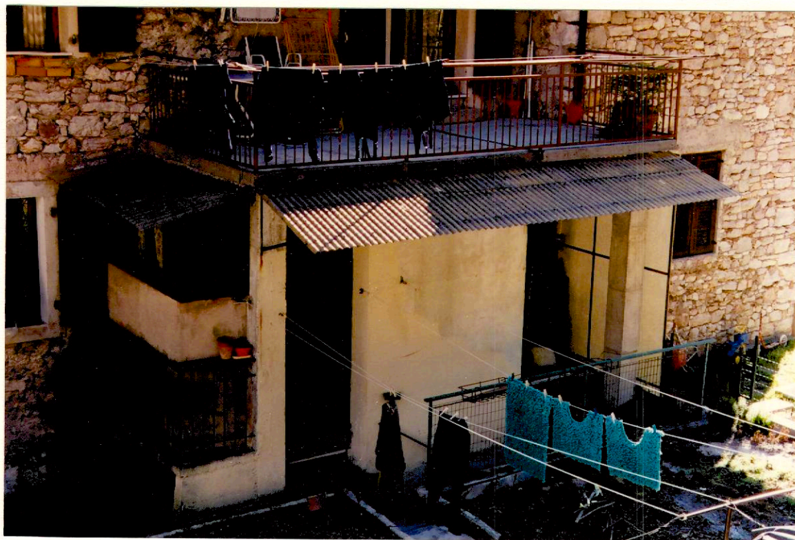
Documentazione fotografica - Immagine 2 (Rif.archivio:negativo__ fotogramma__)