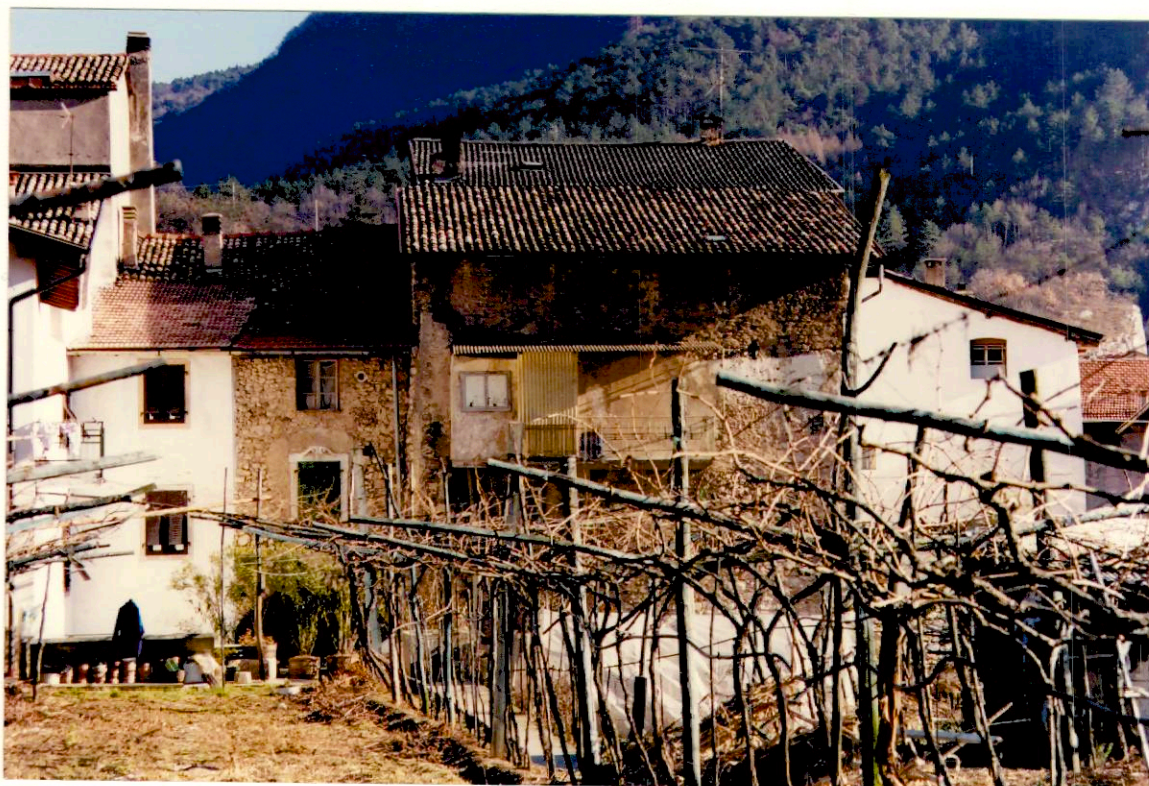
Documentazione fotografica - Immagine 2 (Rif.archivio:negativo__fotogramma__)