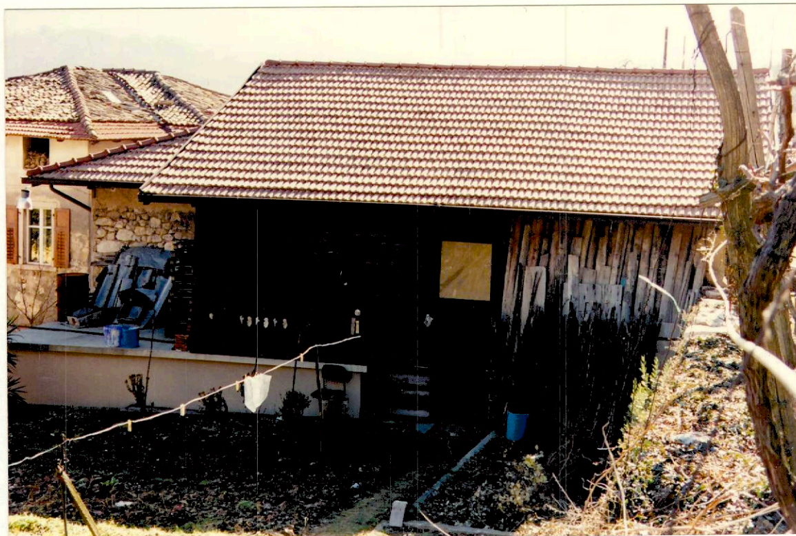
Documentazione fotografica - Immagine 4 (Rif.archivio:negativo __ fotogramma __)