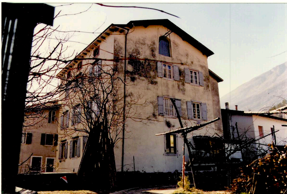
Documentazione fotografica - Immagine 2 (Rif.archivio:negativo __ fotogramma __)