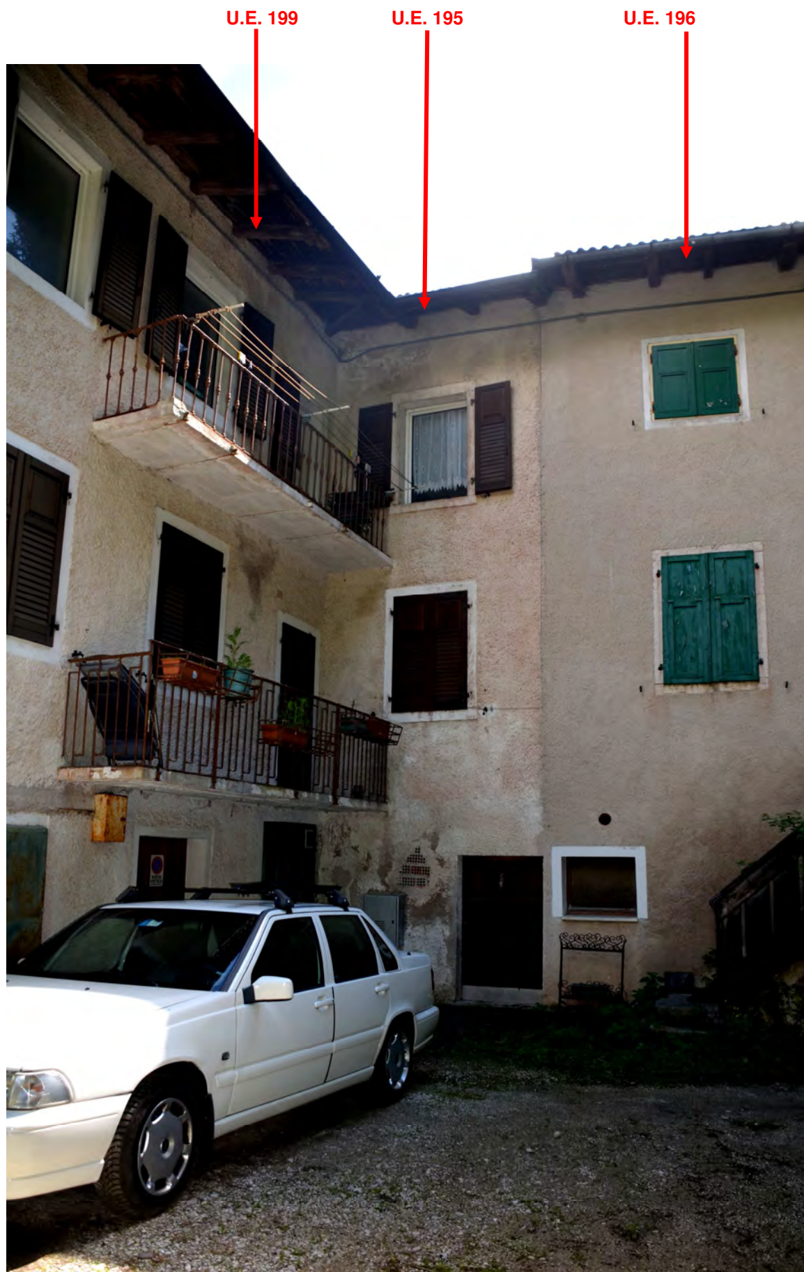
Fronte ovest (retro)