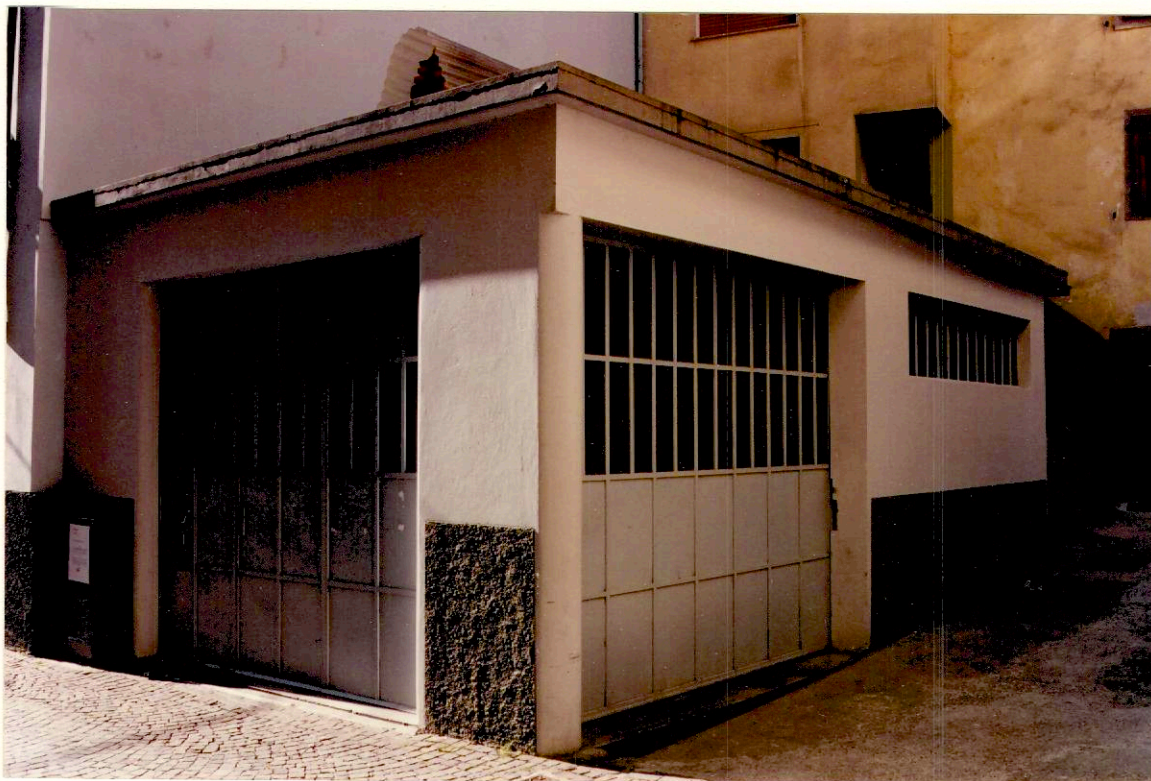
Documentazione fotografica - Immagine 2 (Rif.archivio:negativo__ fotogramma__)