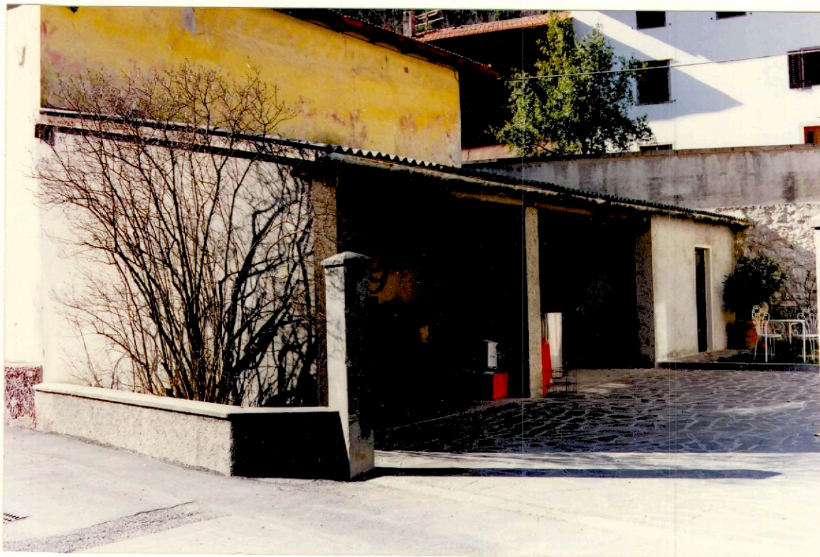
Documentazione fotografica - Immagine 2 (Rif.archivio:negativo__ fotogramma__)