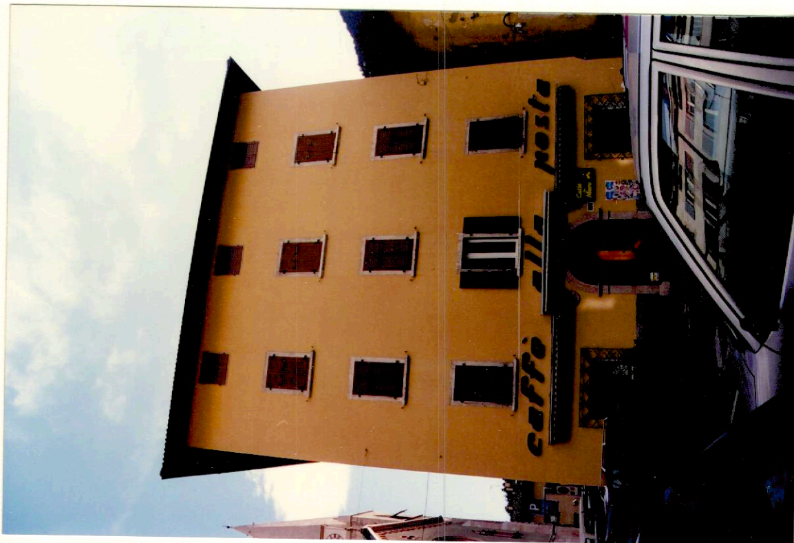
Documentazione fotografica - Immagine 2 (Rif.archivio:negativo___fotogramma___)