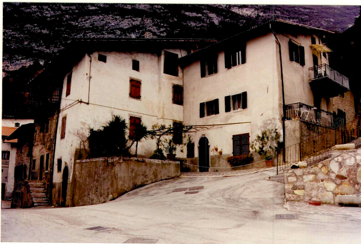
Documentazione fotografica - Immagine 2 (Rif.archivio:negativo__fotogramma__)