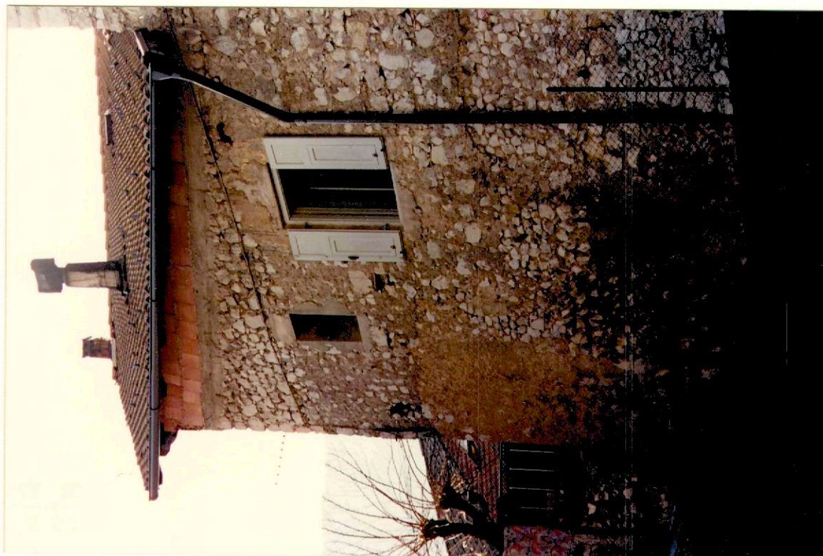
Documentazione fotografica - Immagine 2 (Rif.archivio:negativo___ fotogramma___)