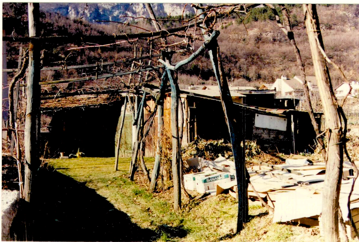
Documentazione fotografica - Immagine 2 (Rif.archivio:negativo___fotogramma___)