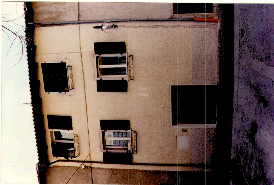
Documentazione fotografica - Immagine 2 (Rif.archivio:negativo fotogramma )