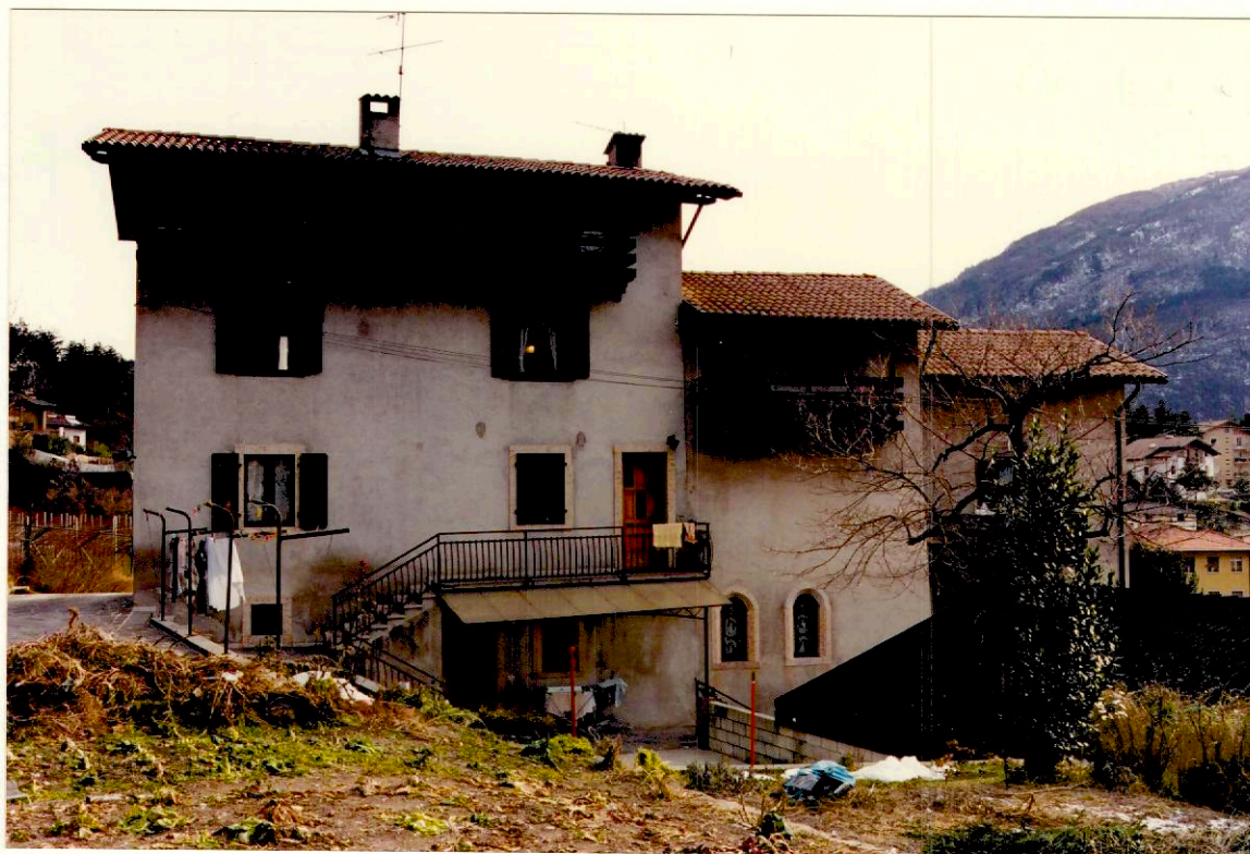
Documentazione fotografica - Immagine 4 (Rif.archivio:negativo__ fotogramma__)