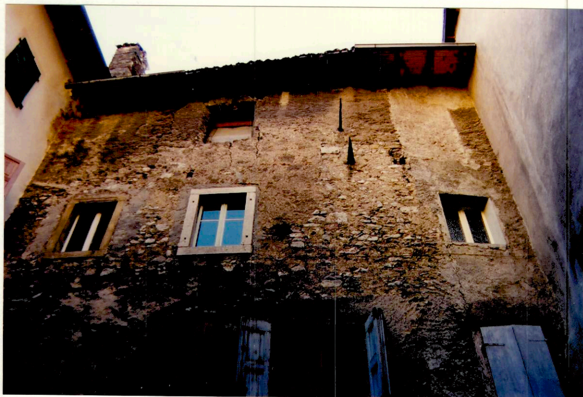
Documentazione fotografica - Immagine 4 (Rif.archivio:negativo__ fotogramma__)