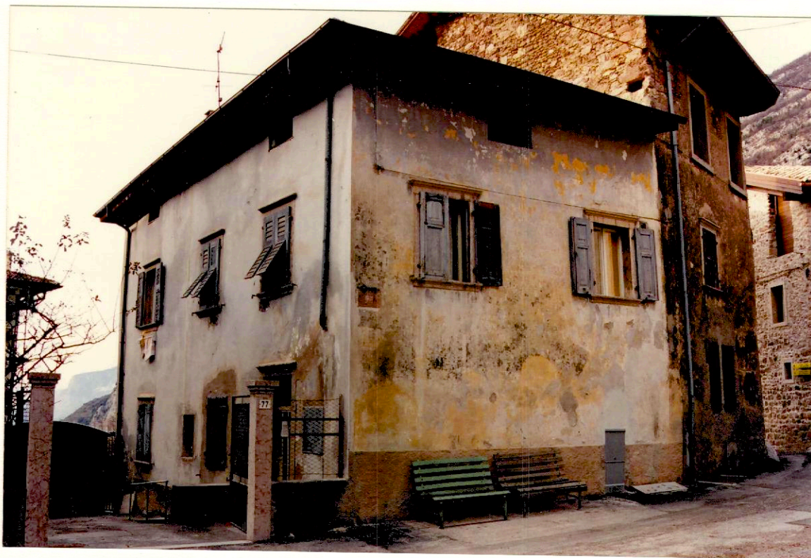
Documentazione fotografica - Immagine 2 (Rif.archivio:negativo___fotogramma___)