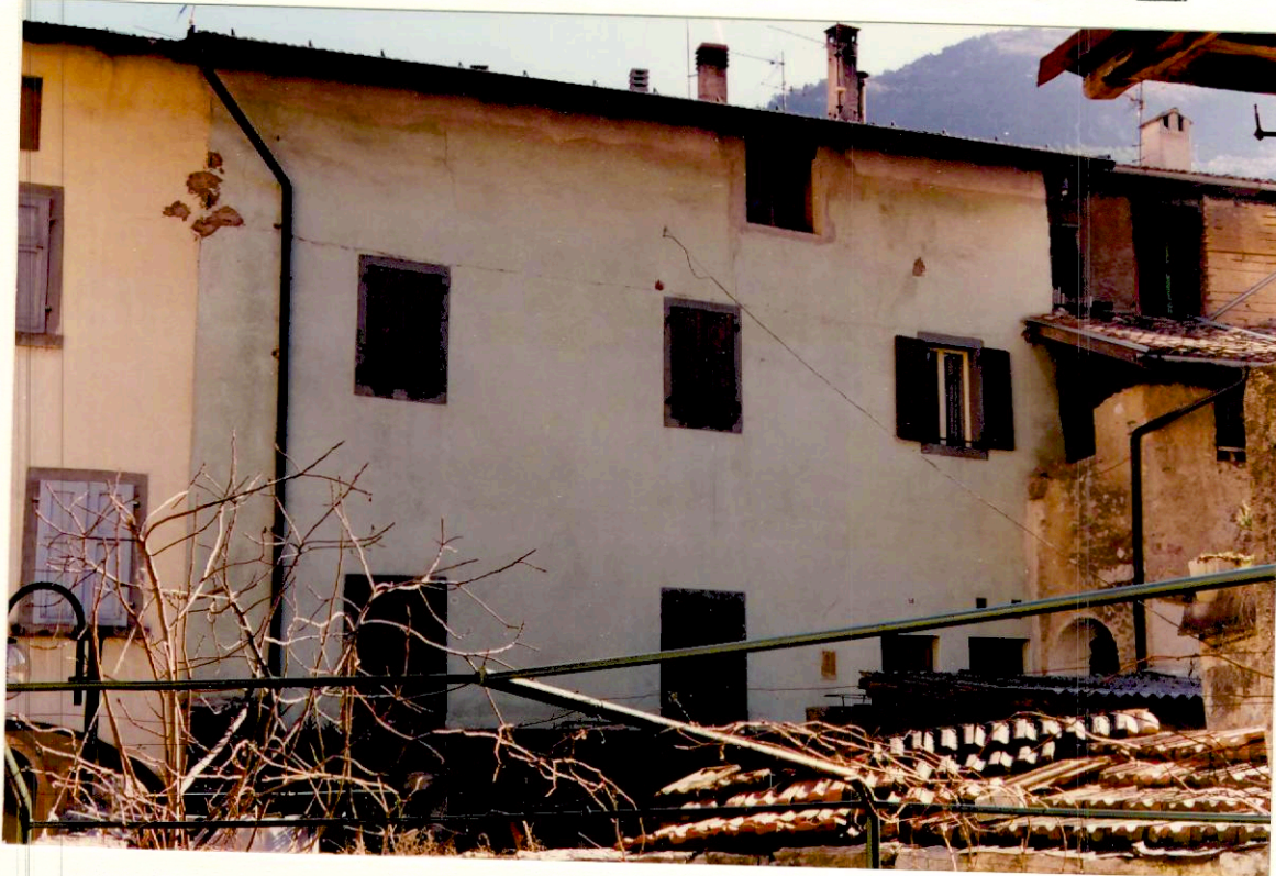
Documentazione fotografica - Immagine 2 (Rif.archivio:negativo ___ fotogramma ___)