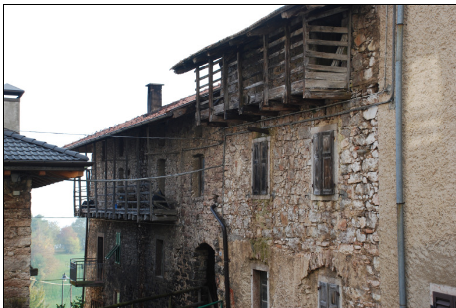
BALCONI ESISTENTI SUGLI EDIFICI ADIACENTI, FRONTE EST