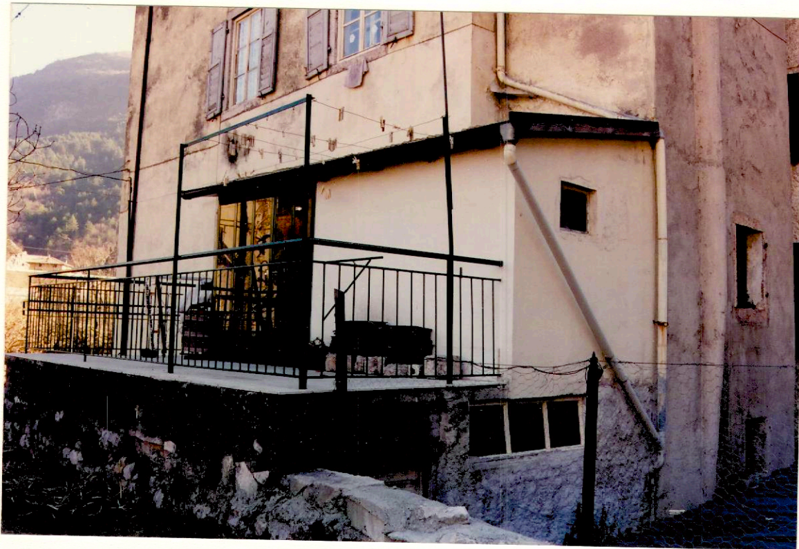
Documentazione fotografica - Immagine 2 (Rif.archivio:negativo___ fotogramma___)