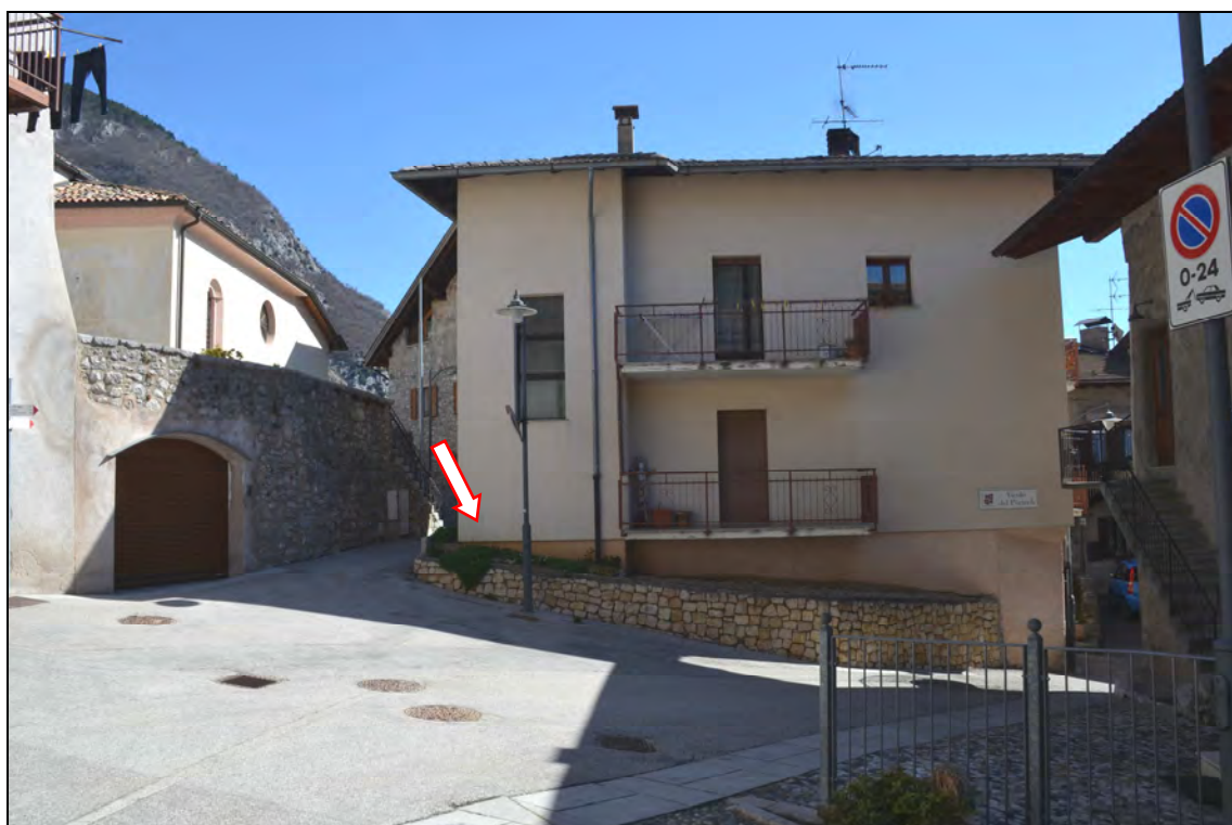
ALLARGAMENTO STRADALE OTTENUTO DALLA DEMOLIZIONE DELLA U.E. N.81