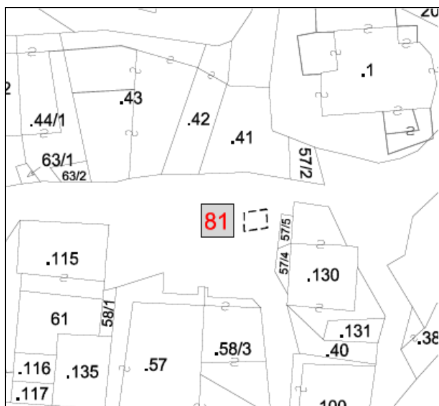
CARTOGRAFIA DEL P.R.G. – I.S. VAR. 2019