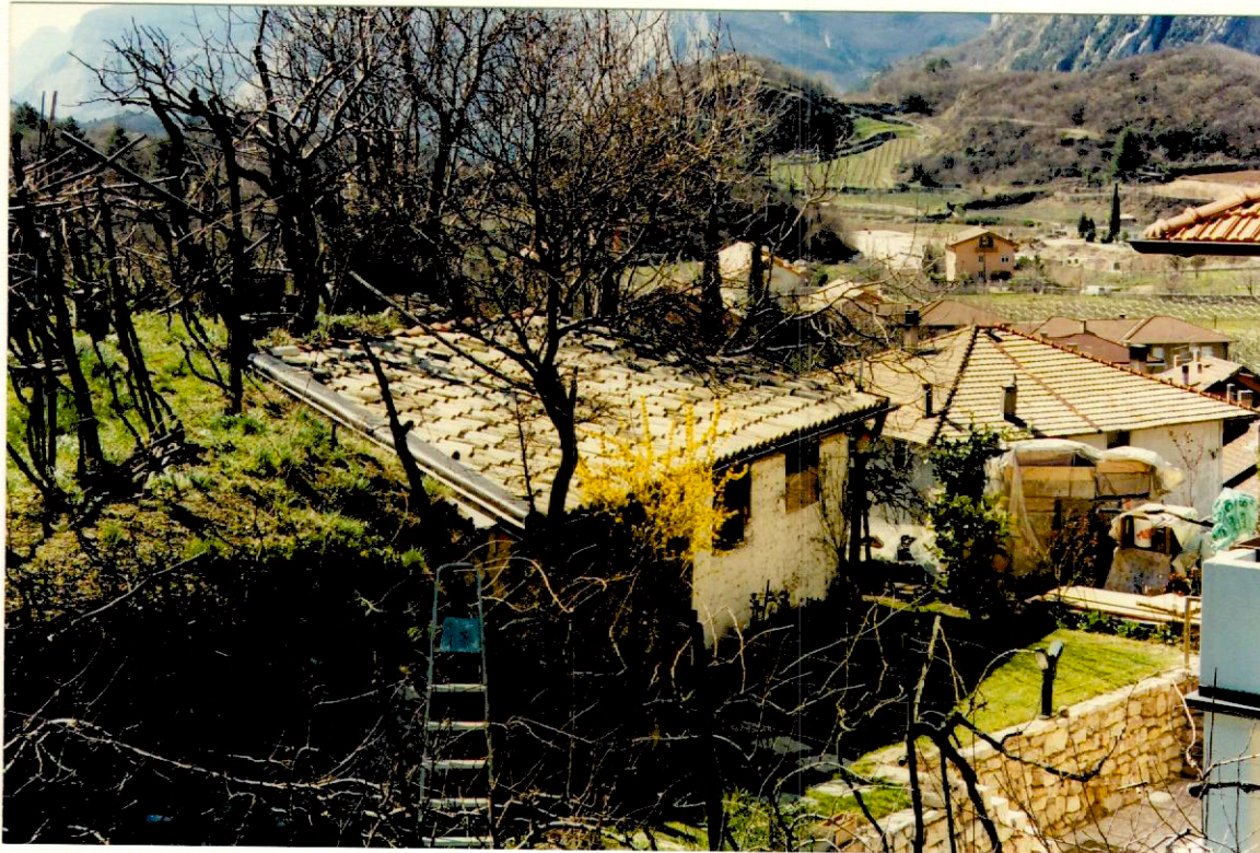
Documentazione fotografica - Immagine 2 (Rif.archivio:negativo__ fotogramma__)