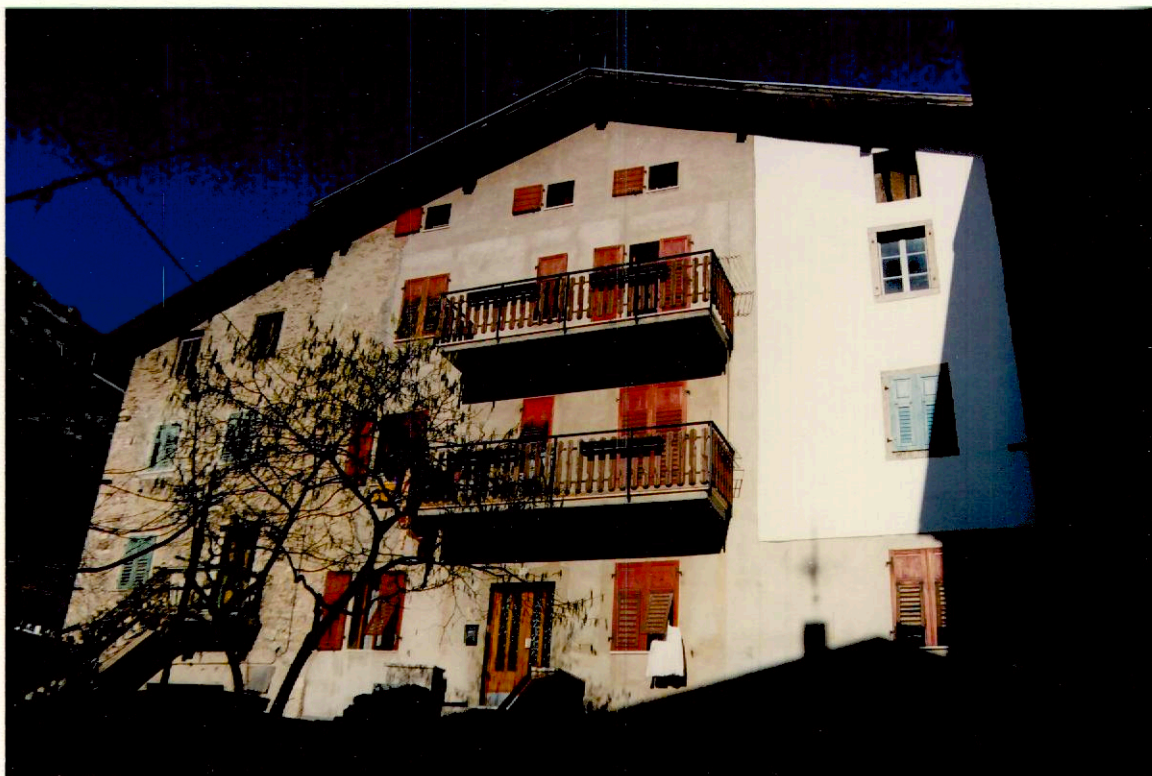
Documentazione fotografica - Immagine 2 (Rif.archivio:negativo__ fotogramma__)