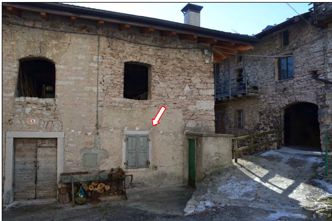
Fronte nord: foro finestra a piano terra trasformabile in porta di ingresso