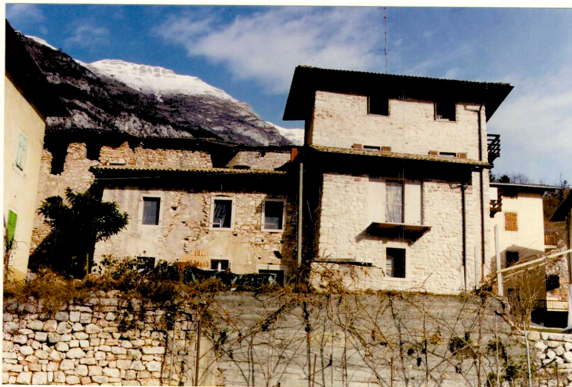
Documentazione fotografica - Immagine 2 (Rif.archivio:negativo ___ fotogramma ___)