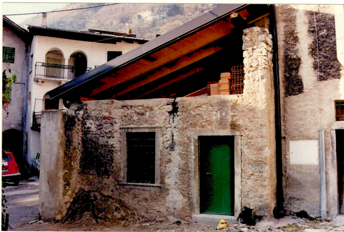
Documentazione fotografica - Immagine 2 (Rif.archivio:negativo___fotogramma___)