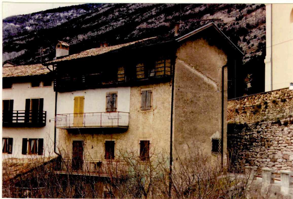
Documentazione fotografica - Immagine 4 (Rif.archivio:negativo __ fotogramma __)