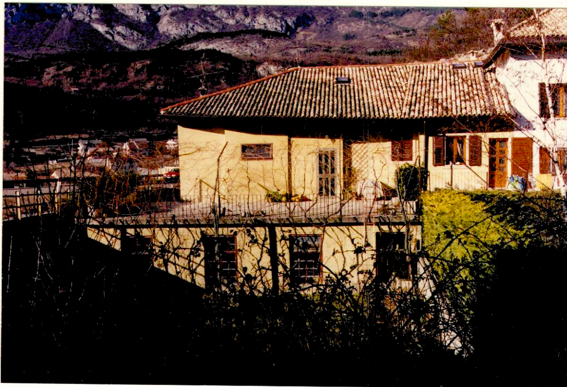
Documentazione fotografica - Immagine 2 (Rif.archivio:negativo __ fotogramma __)