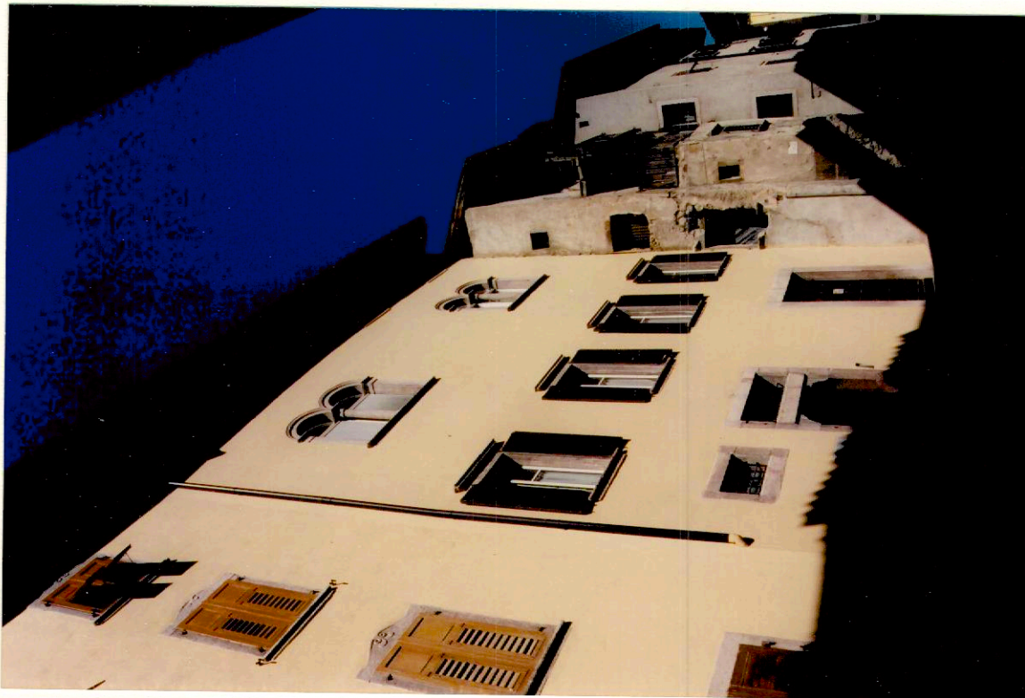
Documentazione fotografica - Immagine 2 (Rif.archivio:negativo___fotogramma___)