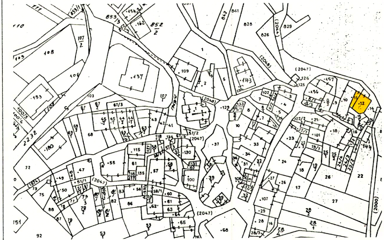
Indicazione della ripresa fotografica sulla base cartografica di piano