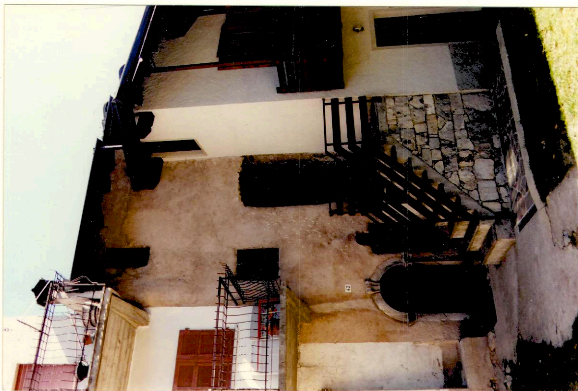
Documentazione fotografica - Immagine 2 (Rif.archivio:negativo___fotogramma___)