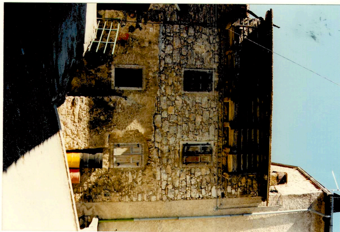
Documentazione fotografica - Immagine 1 (Rif.archivio:negativo 2Mfotogramma 10)