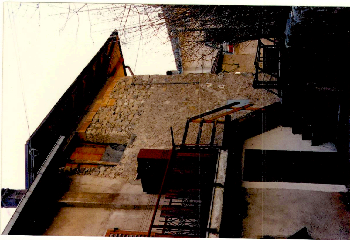
Documentazione fotografica - Immagine 2 (Rif.archivio:negativo__ fotogramma__)