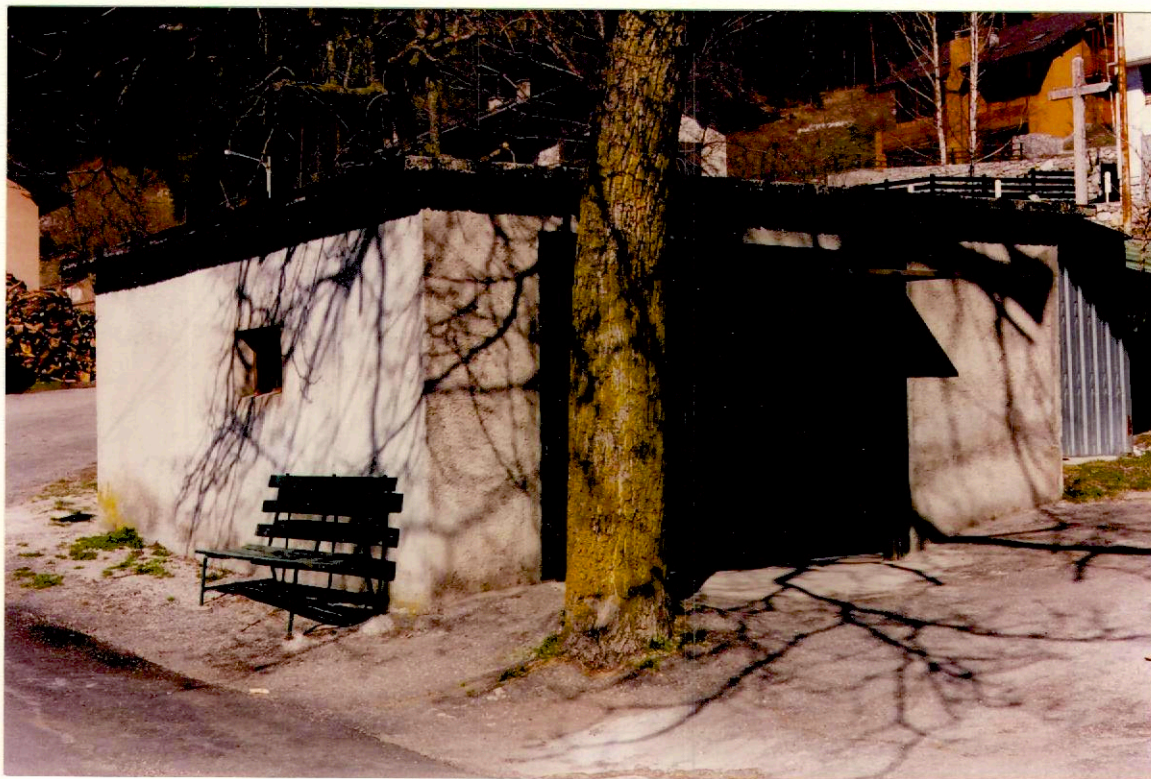
Documentazione fotografica - Immagine 2 (Rif.archivio:negativo ___ fotogramma ___)