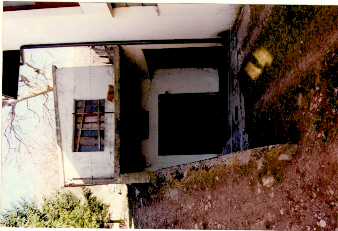
Documentazione fotografica - Immagine 2 (Rif.archivio:negativo___fotogramma___)