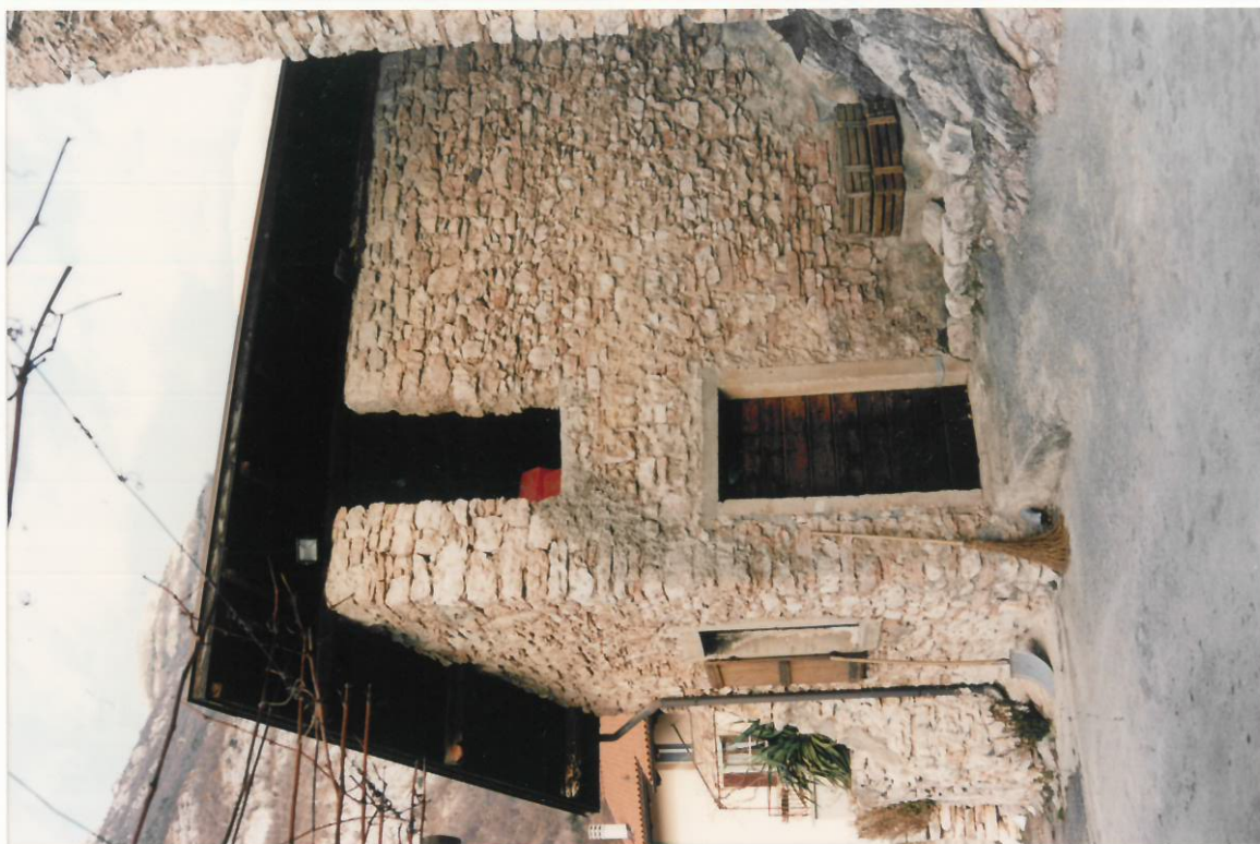
Documentazione fotografica - Immagine 2 (Rif.archivio:negativo__ fotogramma__)