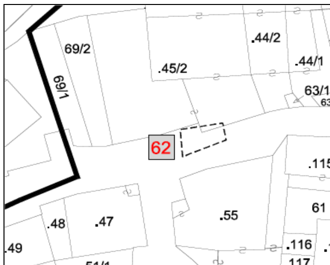
CARTOGRAFIA DEL P.R.G. – I.S. VAR. 2019