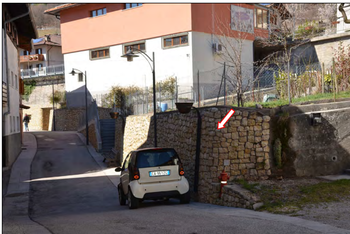
SPAZIO PUBBLICO OTTENUTO DALLA DEMOLIZIONE DELLA U.E. N.62