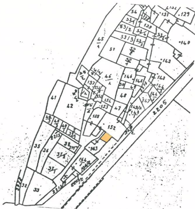
Indicazione della ripresa fotografica sulla base cartografica di piano