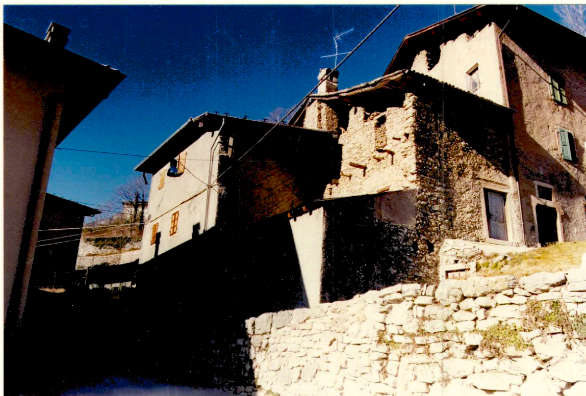
Documentazione fotografica - Immagine 2 (Rif.archivio:negativo __ fotogramma __)